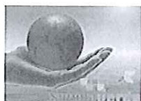
Nuvolaverde, il digitale per la sostenibilità: nuovo comitato italiano per la Green Economy

Tempo di novità per la Green Economy in Italia: il Governo – o meglio il ministro dell'Ambiente Corrado Clini - oltre ad aver annunciato l'arrivo di un fondo da un miliardo di euro per il Piano di crescita sostenibile con investimenti in efficienza energetica, fonti rinnovabili e innovazione, ha presentato il nuovo comitato Nuvolaverde – il digitale per la sostenibilità , co-promosso con Piccola Industria – Confindustria, Expo 2015, Anitec e Venice International